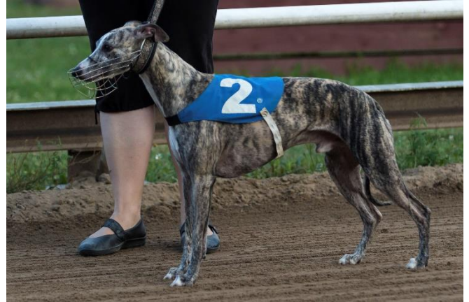
Napilla kiinnittyvä kangasmantteli