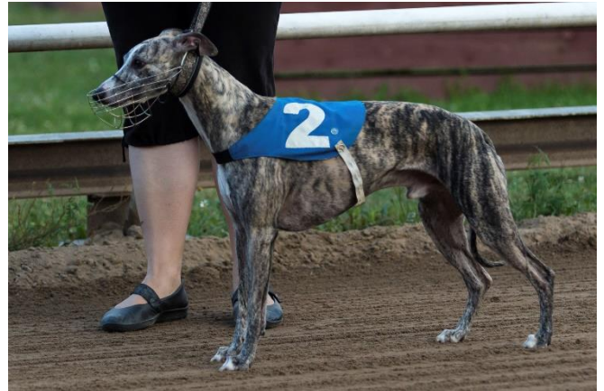
Napilla kiinnittyvä kangasmantteli