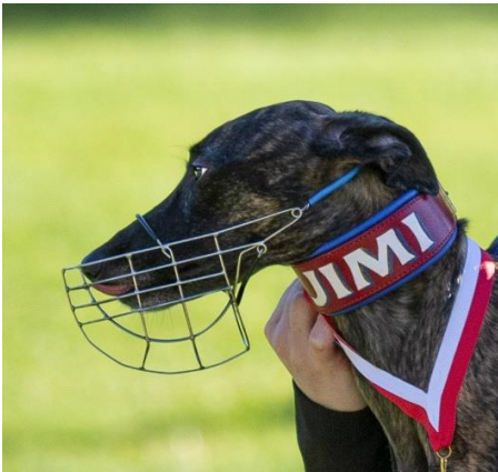
Australialainen koppa juotettua teräslankaa

GRL:n kilpailuissa on sallittu kolme erilaista koppamallia: