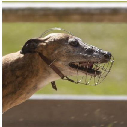
Englantilainen koppa materiaali vaihtelee

Tässä kopassa solkikiinnitys poikkeuksellisesti sallitaan, sillä kiinnitys kulkee kaulan ympärillä .